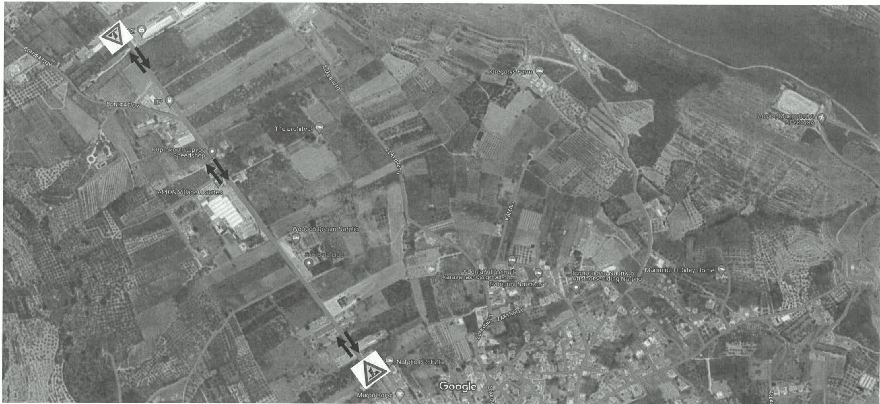
Εικόνες ©2024 Airbus, CNES / Airbus, Maxar Technologies, Δεδομένα χάρτη ©2024 100 μέτρα